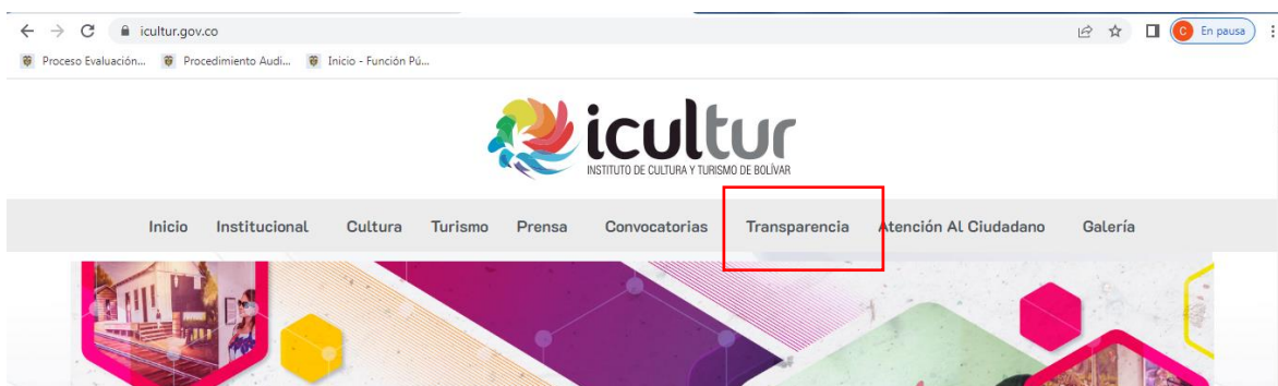
Figura 1. Botón de transparencia en la página web

Posteriormente, se realizó un conteo de los ítems cumplidos por componentes, arrojando el siguiente resultado: